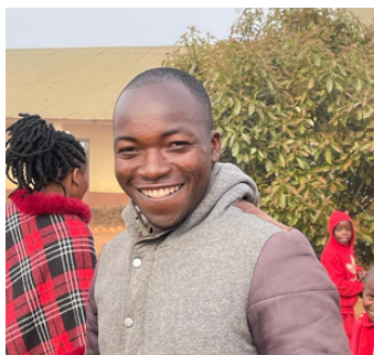
FILOMENUS METHOD FWALO