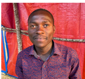
NATIONAL AYUBU MPIKA